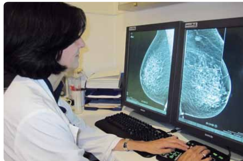
Die Radiologin untersucht sorgfältig die Röntgenbilder.

Hohe Qualität: Bei der Teilnahme an einem Brustkrebs-Früherkennungsprogramm profitieren Frauen von einer Mammografie-Untersuchung, deren Qualität hohen Anforderungen entspricht und die regelmässig überprüft wird (s. Kasten).